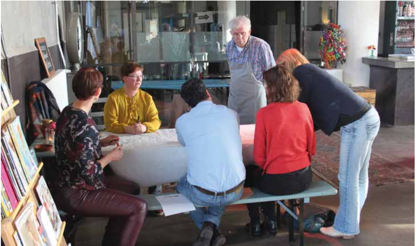
Sessie in het 'World Café' van medewerkers Vluchtelingenwerk Oost Nederland

deze competenties te beschikken. Verder kwam naar voren dat de diverse reorganisaties waarmee de medewerkers in de afgelopen jaren te maken kregen kunnen zorgen voor verhoging van de werkdruk. Daar kwam nog bij de aansturing van vrijwilligers van wie er veel nieuw en onervaren waren.